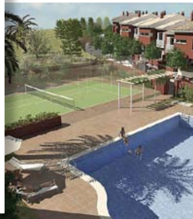
Piscina y pistas de pádel