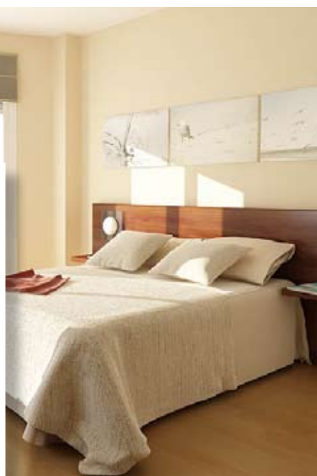
Hasta 5 dormitorios