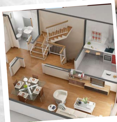
Las mejores calidades