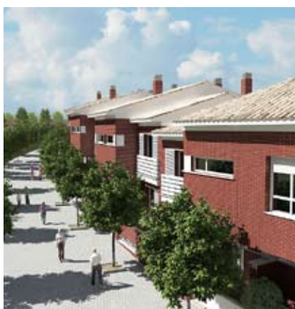
Avenidas amplias y jardineadas